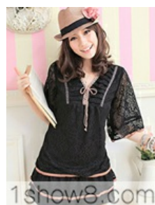
1show8.com LY-1291 ĩĩ~ c :÷240C 240 C 6ĭ | -p